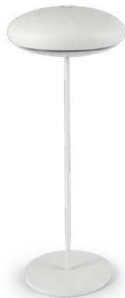
Nuvola bianco Nuvola, white