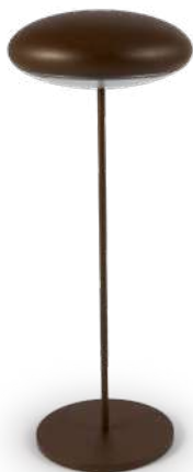
Nuvola corten Nuvola, corten