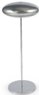
Nuvola acciaio Nuvola, steel