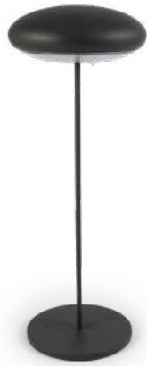
Nuvola antracite Nuvola, anthracite